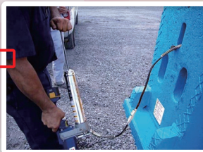
従来のグリース給脂