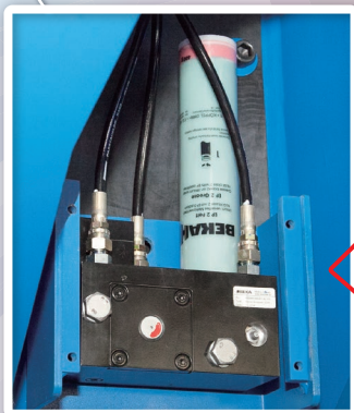
オートグリースシステム Hamax2 Compact

ブレーカで最大の消耗部品であるチゼルブッシュ・リテーナピンなどの摩耗を最小限に抑え、部品寿命を延ばすことで、油圧ブレーカのランニングコスト低減化をサポートします。