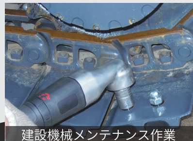
建設機械メンテナンス作業

*性能は使用空気圧 0.6MPa(6kgf/cm 2 )の数値です。 *本カタログの仕様は、改良のため予告なく変更することがございます。