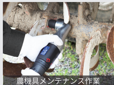
農機具メンテナンス作業