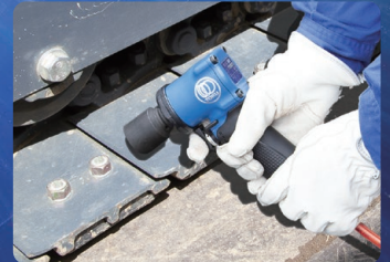
■ 建機メンテナンス作業