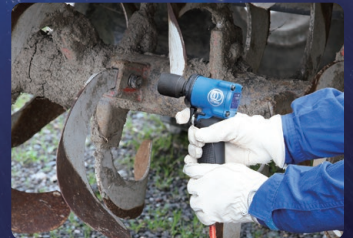
■ 農機具メンテナンス作業