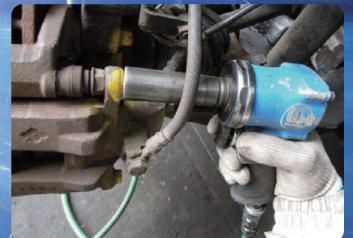
■ キャリパー脱着作業