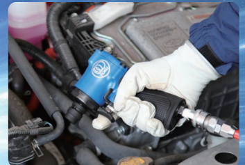
■ エンジンルーム・メンテナンス作業